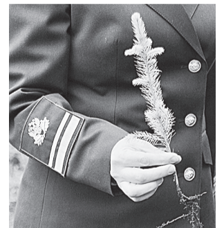
Сосновые саженцы в надёжных руках